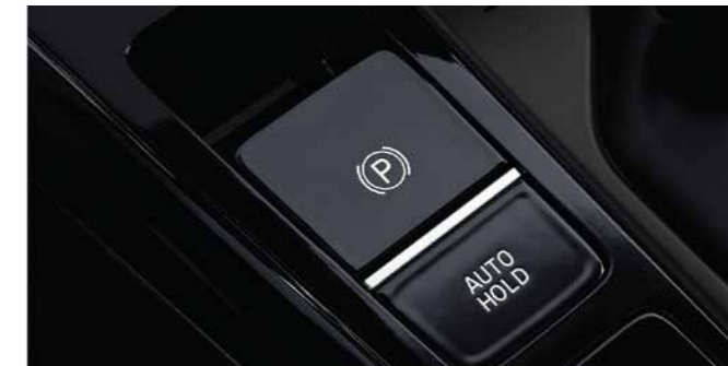
Electric Parking Brake