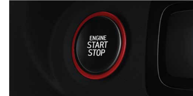
Push Start Button

Nothing will stand in the way of your comfort with premium features such as a Panoramic Sunroof, wireless smartphone charging, Power Adjustable Driver Seat, all designed to give you an