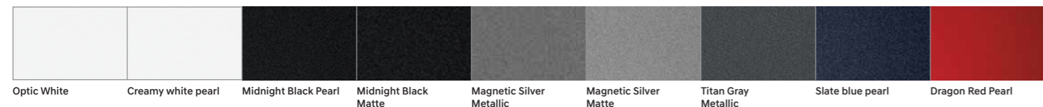
Optic White Creamy white pearl Midnight Black Pearl Midnight Black Matte Magnetic Silver Metallic Magnetic Silver Matte Titan Gray Metallic Slate blue pearl Dragon Red Pearl