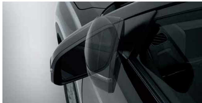
Outside Rear View Mirror - Power Folding