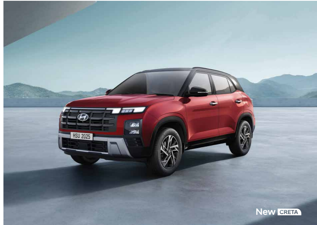
Black Chrome Parametric Front Grille