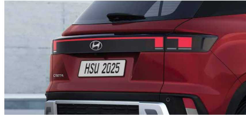
LED Rear Combination Lamp

A progressive design with sharper contour lines makes the New CRETA even more eye-catching. Featuring a more futuristic appearance, it is the perfect SUV for an urban lifestyle. This new design is crafted to boost your confidence in conquering any challenges ahead.