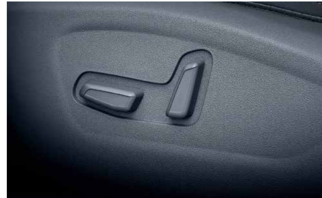
Power Adjustable Driver Seat (8-Way)