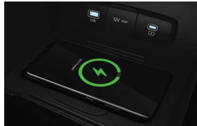
Wireless Smartphone Charging