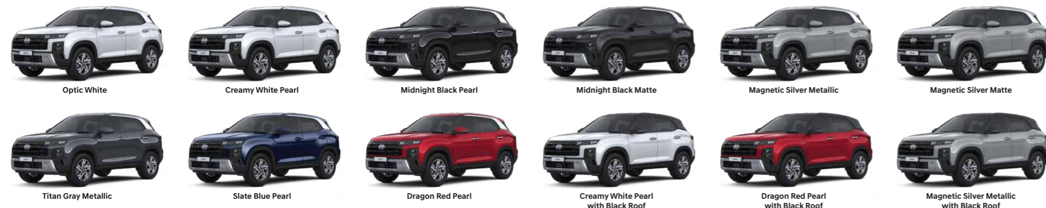
Optic White Creamy White Pearl Midnight Black Pearl Midnight Black Matte Magnetic Silver Metallic Magnetic Silver Matte Titan Gray Metallic Slate Blue Pearl Dragon Red Pearl Creamy White Pearl with Black Roof Dragon Red Pearl with Black Roof Magnetic Silver Metallic with Black Roof